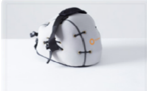
日本人用に開発されたキャップ

頭皮冷却療法 とは：「頭皮冷却装置」は装置内でマイナス4度に冷却した冷却液を専用のキャップ内に循環させ、継続的に頭皮を冷却します。頭皮冷却を行うことにより、化学療法が毛包に与えるダメージを軽減でき、発毛回復への効果があります。