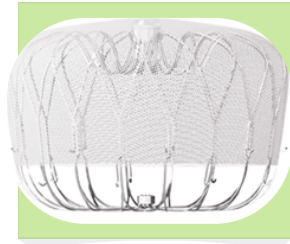
◀ Watchman デバイス